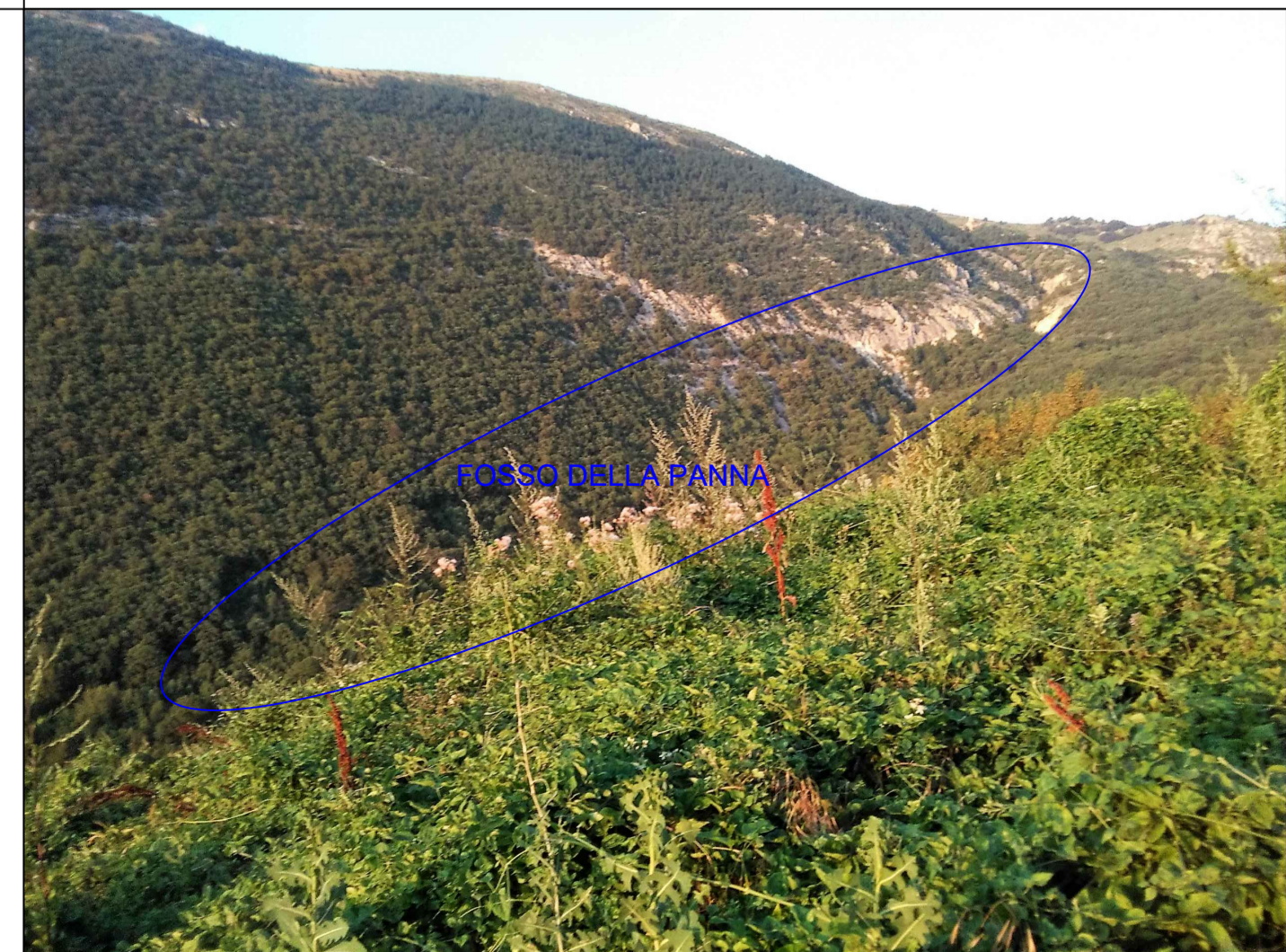
VISTA DEL FOSSO DELLA PANNA DAL COLLE DEL PALO