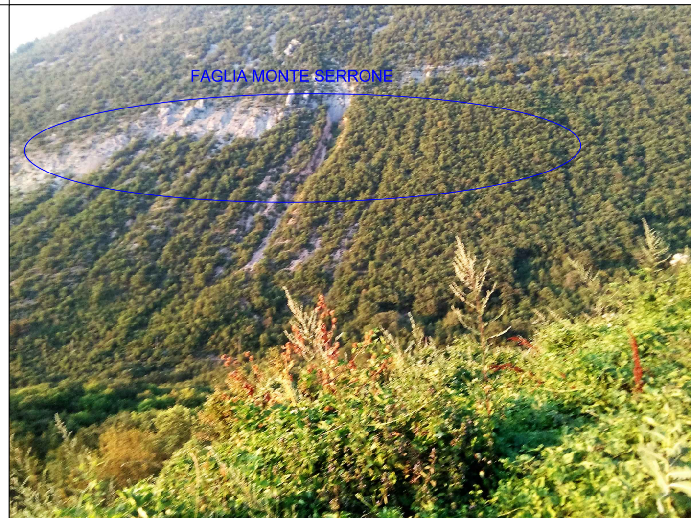
VISTA DELLA FAGLIA DI MONTE SERRONE DAL COLLE DEL PALO