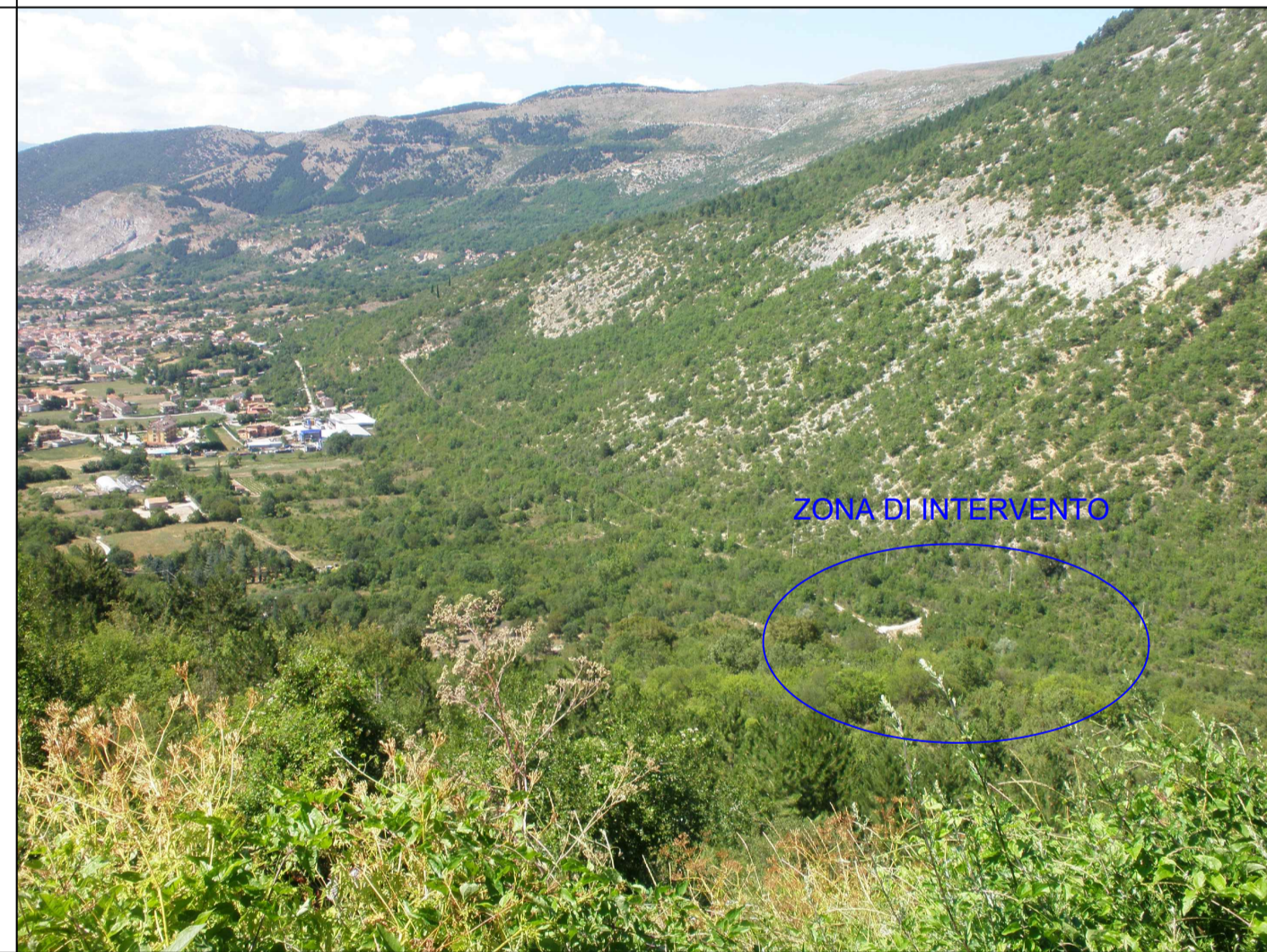
VISTA DELLA ZONA DI INTERVENTO DAL COLLE DEL PALO