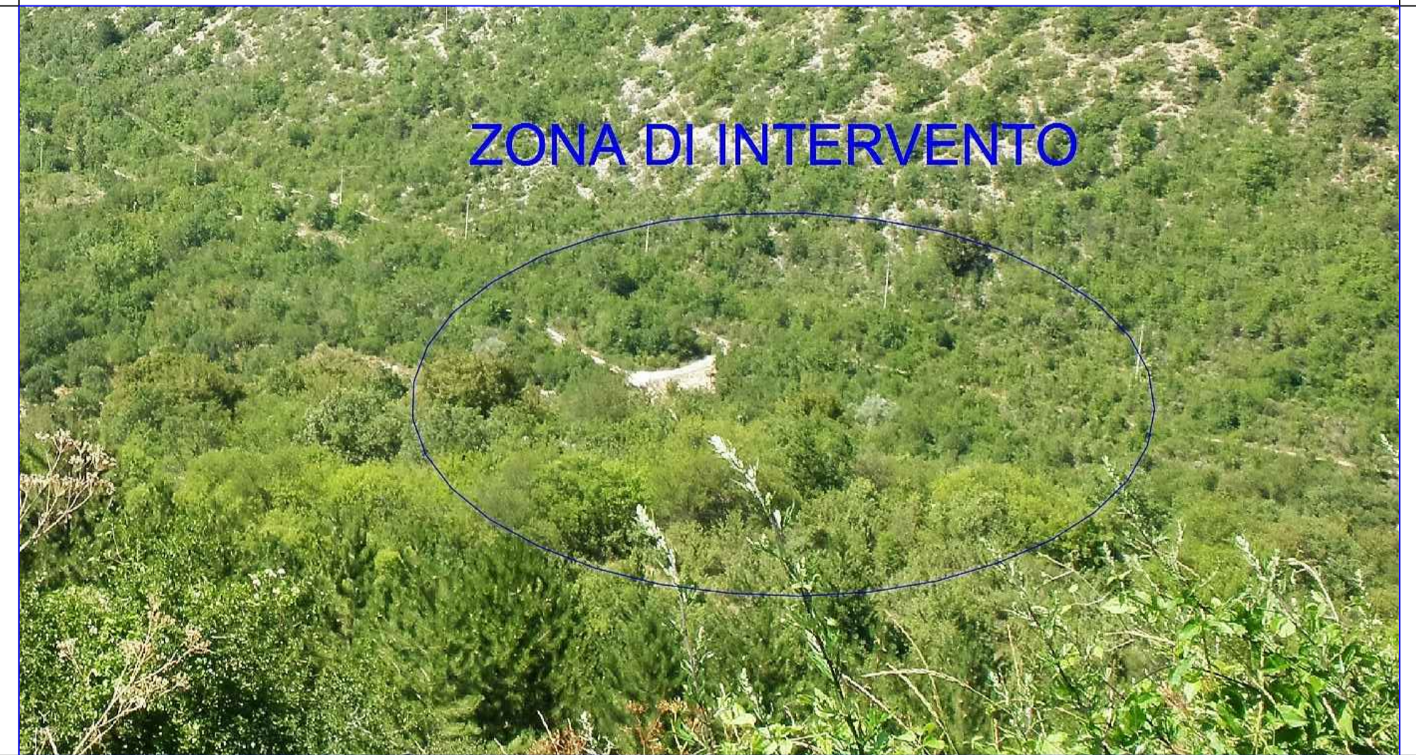
PARTICOLARE ZONA DI INTERVENTO