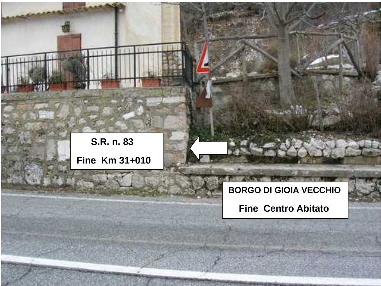
S.R. n. 83 – Fine Centro Abitato Km 31+010