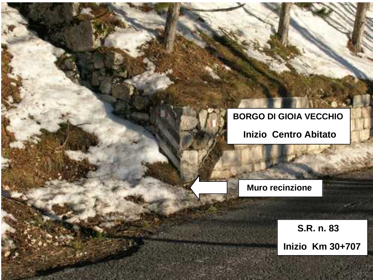
S.R. n. 83 – Inizio Centro Abitato Km 30+707 (Muro recinzione struttura comunale)