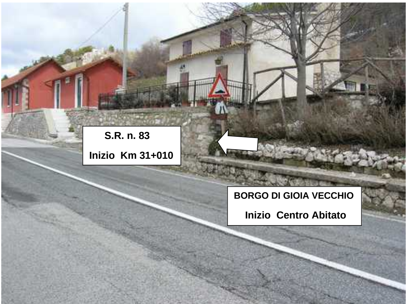
S.R. n. 83 – Inizio Centro Abitato Km 31+010